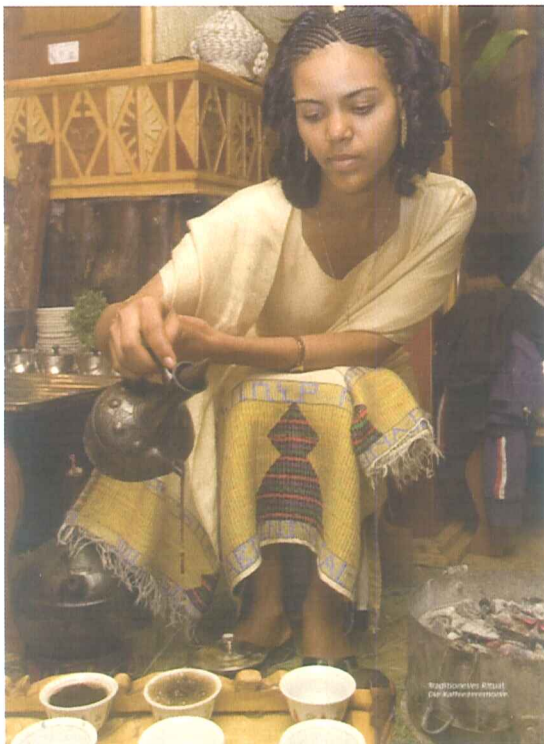
Traditionelle Kaffeezeremonie in Äthiopien, der Urheimat des Kaffees:

Gräser werden auf dem Boden arrangiert, darauf steht ein kleiner Holzkohleofen, ein gusseisernes Pfännchen und ein ausgehöhlter Stein. Zunächst werden frische grüne Kaffeebohnen in der Pfanne geröstet. Wenn sie schwarz glänzen und ihr aromatisches Öl freigeben, werden sie mit einem Mörser zerstoßen. Dann werden sie in eine dickbäuchige Tonkanne mit kochendem Wasser gefüllt. Das Ganze wird mit Zimt, Gewürznelken und Kardamon erneut kurz aufgekocht und durch ein Sieb gedrückt. Schließlich wird der Kaffee aus etwa 30 cm Höhe in filigrane Tassen gegossen - und mit viel Zucker getrunken.